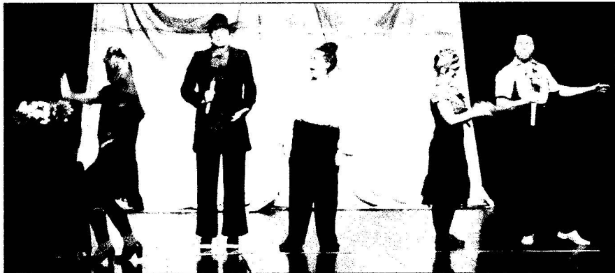
La troupe Burletta .

Le vendredi 2 novembre se tenait à la salle Marc-Lescarbot Burletta , une création regroupant des artistes de différentes catégories. Cinq clowns plus maladroits, plus turbulents, plus attachants les uns que les autres ont fait vivre pendant près d'une heure à 70 personnes un spectacle haut en couleur. L'auditoire était divisé plus ou moins également entre adultes et enfants.